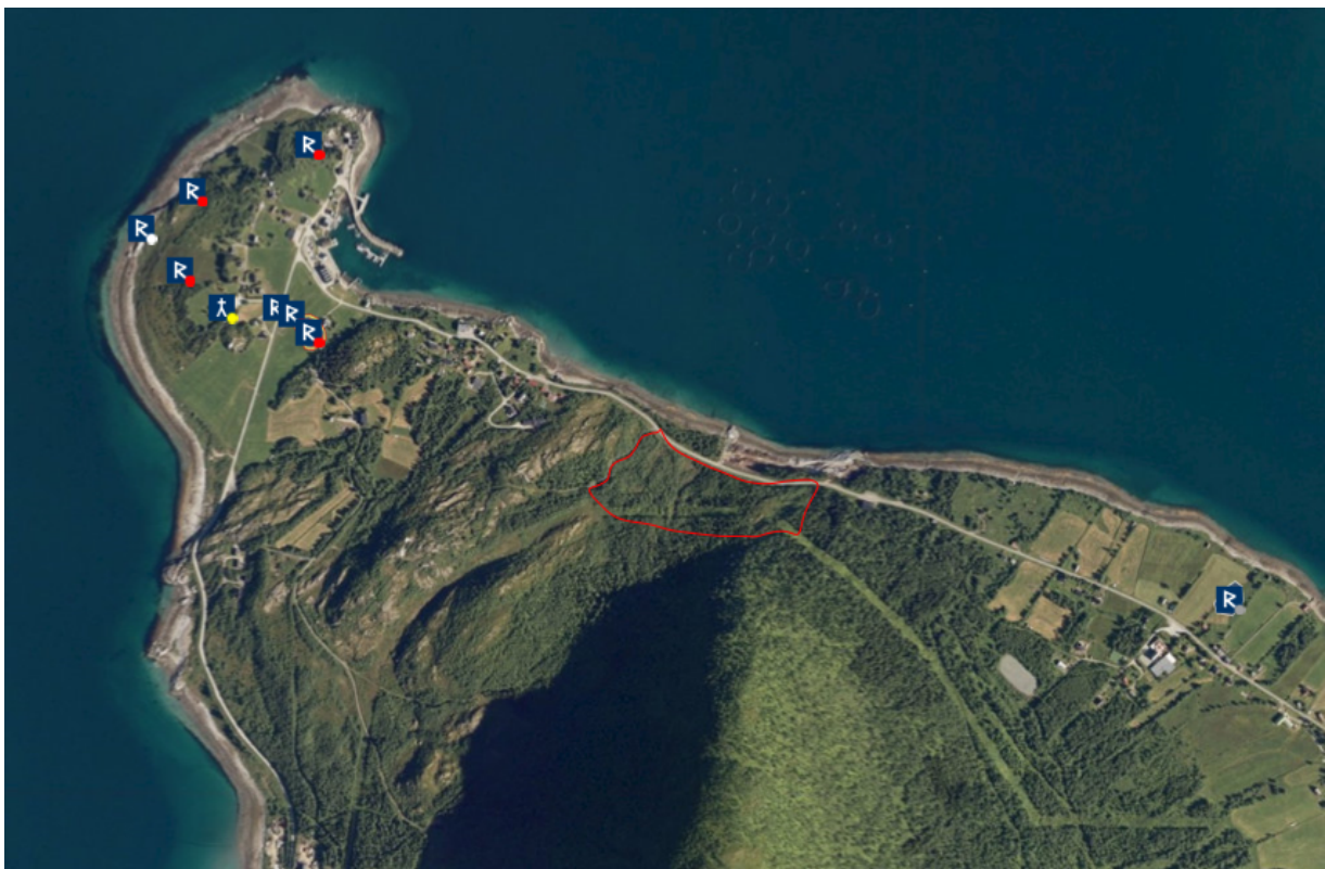
Figur 2: Engenes og Ånderkleiva. Undersøkelsesområde markert med rødt.

De arkeologiske undersøkelsene i regi av Troms fylkeskommune ble foretatt over to uker fra 10- 23.07.2019. Da området strekker seg fra dagens veg på knappe 10 moh. i nord og opp til 125 moh. mot Nappen i sør ble det sett potensiale for funn fra eldre og yngre steinalder samt tidlig metalltid i de delene av området som er innenfor 15-60 moh.