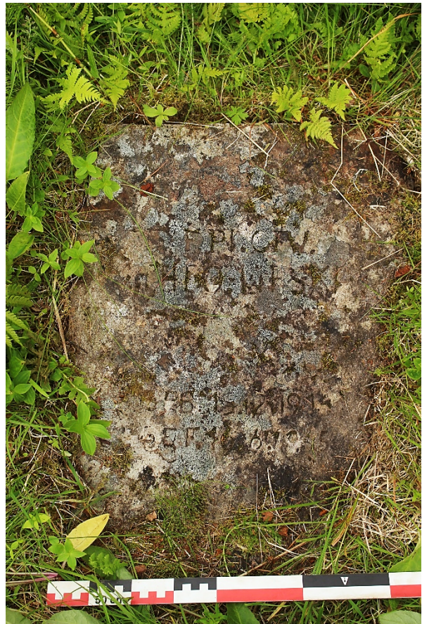
Figur 6: Gravstein

På bakkekanten som kraftlinjen følger fra øst mot vest ved Ånderkleiva ble det dokumentert en liggende gravstein og et stående tremonument like under kraftlinjen. På gravsteinen, som er en del overvokst og en stor del av skriften er vanskelig å lese, står tilsynelatende navnet Theo Lipski. og datoene 15.12.1914 til 16.06.1945. Etter informasjon fra en lokal informant, som kjente til graven, ble det opplyst at selve graven skulle være flyttet like etter krigen og at det ikke skulle være noen gravlagt der i dag, men han understrekte at det var usikkerhet rundt dette. I følge gravsteinen døde Theo Lipski få dager etter krigens slutt i Norge, og informanten fortalte at dette skulle ha skjedd under rydding av et tysk minefelt i området. I årene etter krigen hadde det vært besøk av flere av Theo's medsoldater, men det var nå flere år siden sist. Like bak den liggende gravsteinen står et ca. 2 meter høyt tremonument i form av et kors med to skrå planker fra toppen av korset og ned mot de to armene. Tremonumentet er tydelig yngre enn gravsteinen og det er i bunnen festet i berget med det som ser ut til å være bolter i rustfritt stål. På trekorset står det "zum andenken" (oversatt "til minne"). Ved foten av monumentet ligger også en tysk hjelm fra krigen. Hjelmen er rustet og har enkelte skader, men er ellers hel. Den lokale informanten kunne også opplyse om at de ved elgjakten på høsten henger opp hjelmen på tremonumentet.