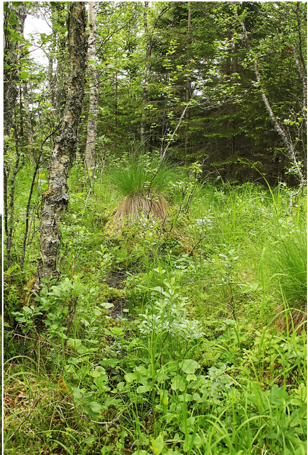
Figur 3: Område for prøvestikking