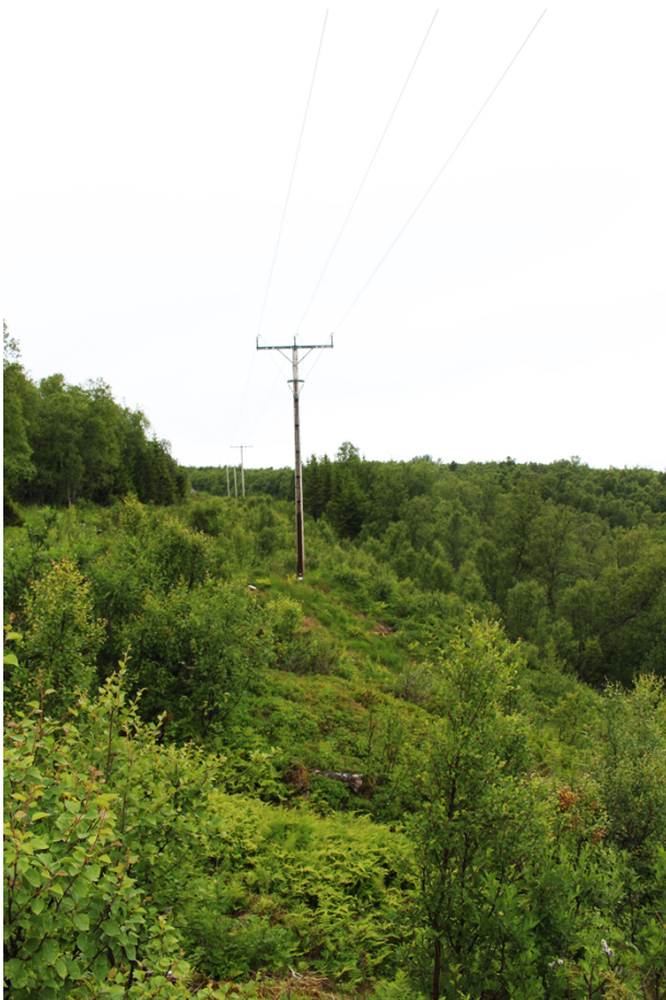
Figur 4: Kraftlinjetrasé, sett mot vest

Undersøkelsesområdet består hovedsakelig av kupert terreng og myrdannelse, som følge av grunnvannutsig fra Nappen. I sør, over 30 moh. består undersøkelsesområdet i hovedsak av myr og noe bjørkekrattskog, med noen mindre granfelt. Lignende myrdannelse og krattskog gjentar seg nedenfor skrenten på ca. 30 moh. Midt i undersøkelsesområdet, på ca 10- 40 moh strekker det seg et plantefelt med gran, fra nord til sør. Forbi plantefeltet i øst strekker det seg en bratt skrent nedenfor lyngkledd berg. Den østlige delen av undersøkelsesområdet er preget av store, mosegrodde steinblokker. To små bekker renner gjennom undersøkelsesområdet og ned mot fjorden. Disse oppstår begge inne på undersøkelsesområdet, den ene nedenfor og den andre rett ovenfor skrenten ved 30 moh. Ved den østligste bekken er det spor etter anleggsarbeid i forbindelse med kraftlinjetraséen. Det er planert ut et 6 m bredt felt langs bekken, som leder fra kraftlinja og ned mot veien.