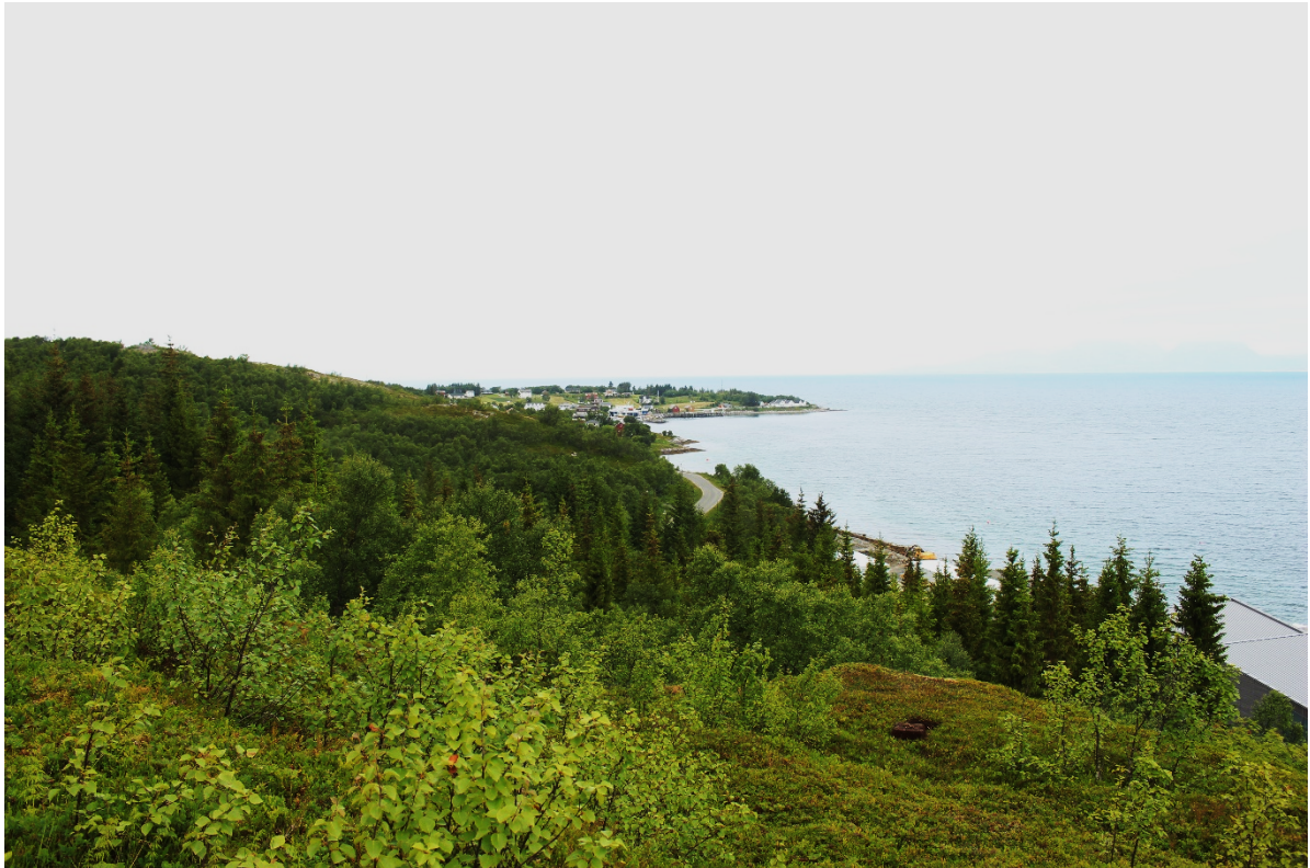
Figur 1: Undersøkellesområdet, med Engenes i bakgrunnen.