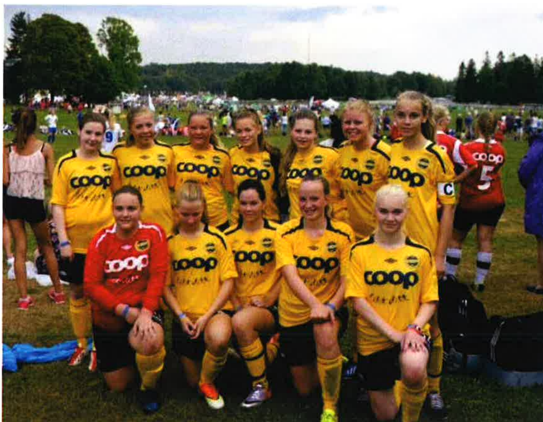
Ibestad ILs jentelag på Norway Cup 2014