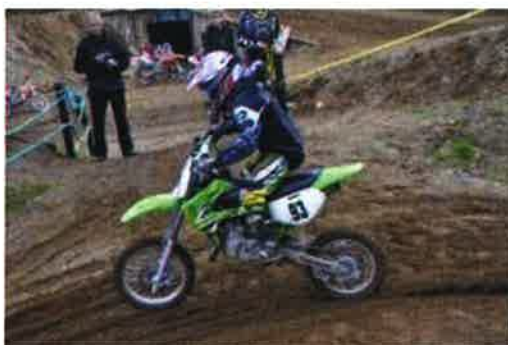
Fra åpningen av Motorsportsbanen på Skjellavollen, Ibestad

Safety Signal System, SSS er et nyutviklet sikkerhetssystem som skal ivareta sikkerheten innenfor motocross og motorsport. Ibestad Motorsportsklubben og banefasilitetene der vil bli brukt som arena for videreutvikling og som et demoanlegg utad. Pilotprosjekt kalt SSS- støttes gjennom Innovasjon Norge og første prototype er delvis ferdig.