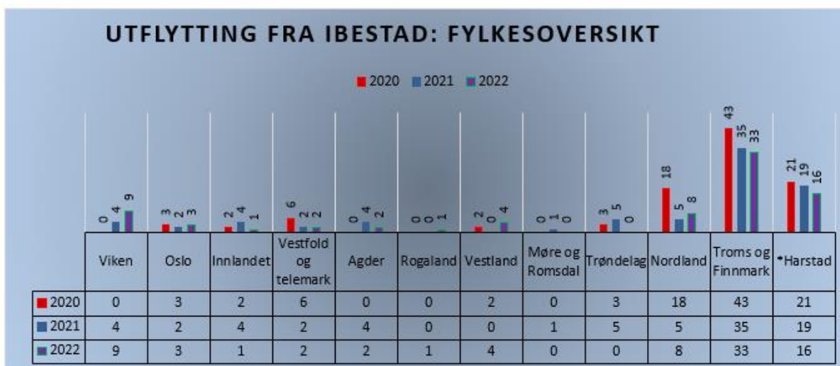
Figur 7 Flytting fra Ibestad til spesifisert fylke, 2020-2022, antall personer