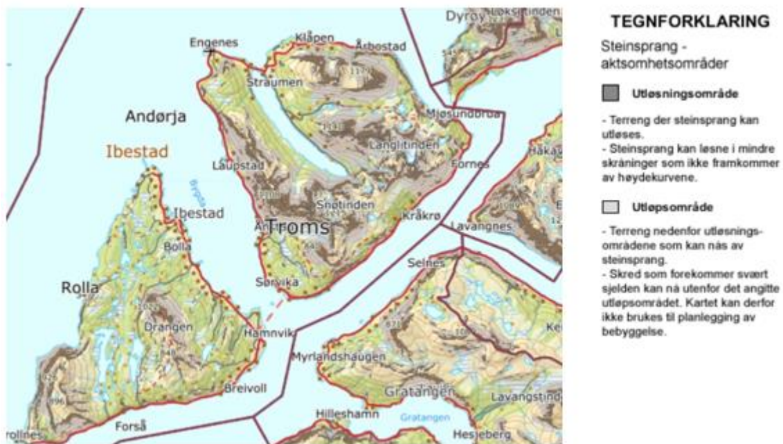
Figur 34 Aktsomhetskart: Steinsprang