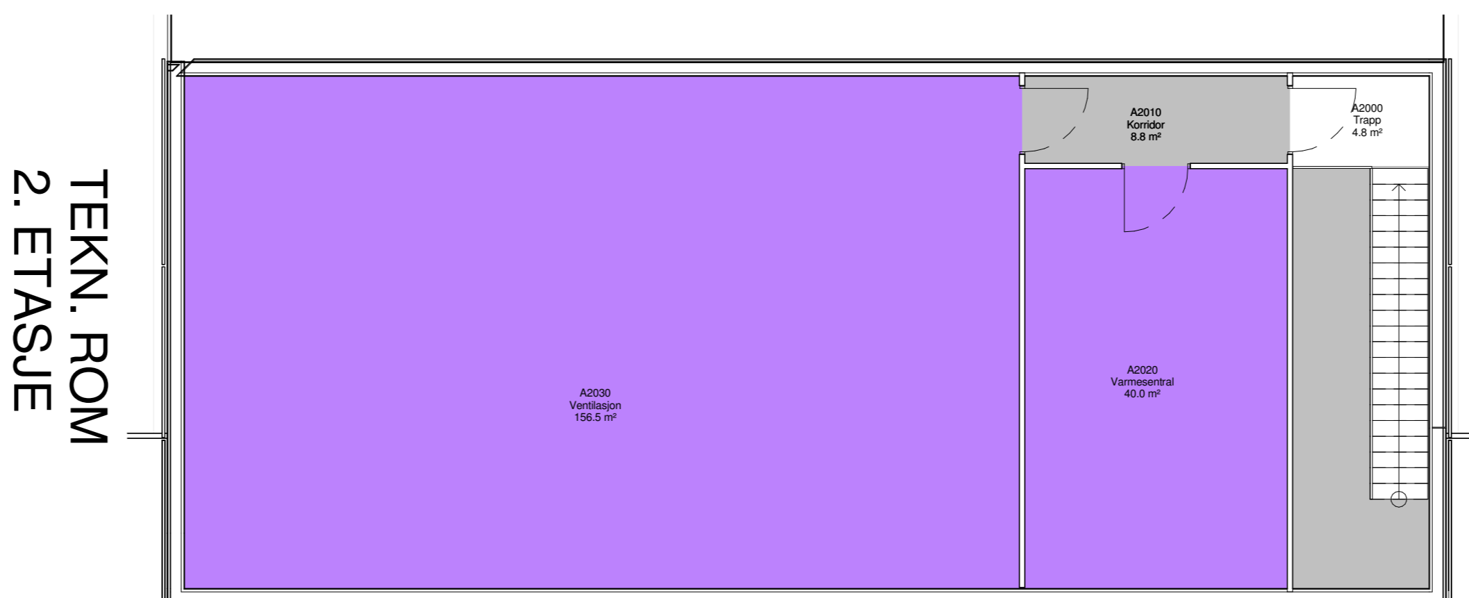
TEKN. ROM 2. ETASJE