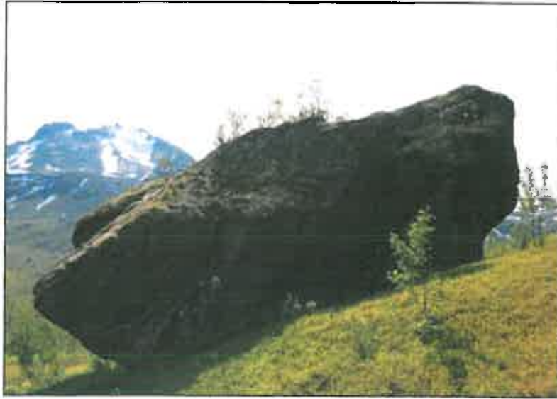
Offersteinen i Stormyra ved Gressdalen